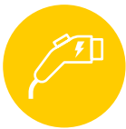
ABBILDUNG 1: BEGRIFFSBESTIMMUNGEN DER EUROPÄISCHEN VERORDNUNG ÜBER DEN AUFBAU DER INFRASTRUKTUR FÜR ALTERNATIVE KRAFTSTOFFE (AFIR)

Ladepunkt: bezeichnet eine feste oder mobile, netzgebundene oder netzunabhängige Schnittstelle für die Übertragung von Strom auf ein Elektrofahrzeug, die zwar einen oder mehrere Anschlüsse für unterschiedliche Arten von Anschlüssen haben kann, an der aber zur selben Zeit nur ein Elektrofahrzeug aufgeladen werden kann, mit Ausnahme von Vorrichtungen mit einer Ladeleistung von höchstens 3,7 kW, deren Hauptzweck nicht das Aufladen von Elektrofahrzeugen ist (Art. 2 Abs. 48 AFIR)