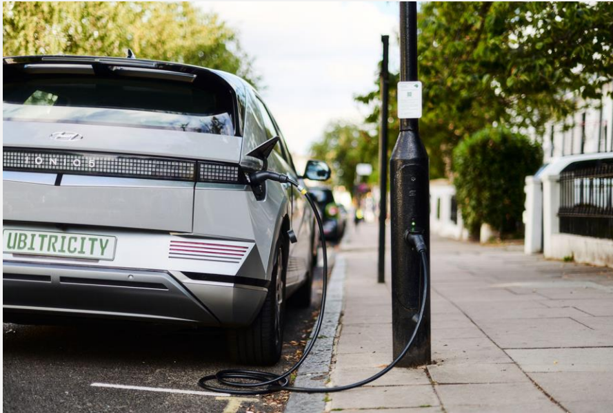
Laternenladen in Großbritannien