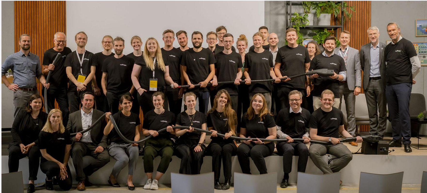
Das Team der Nationalen Leitstelle Ladeinfrastruktur bei der LISKON 2022