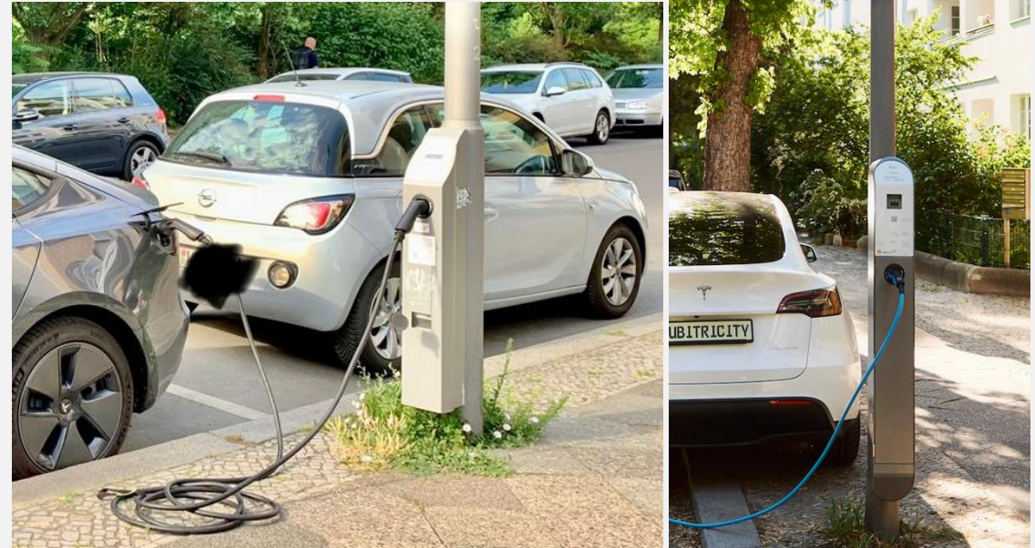
Laternenladen in Deutschland (Anmerkung: linke Darstellung zeigt ältere Lösung)